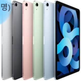
아이패드 에어 4세대